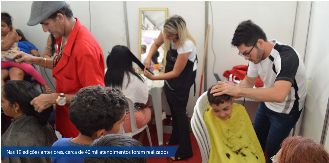
Nas 19 edições anteriores, cerca de 40 mil atendimentos foram realizados

Evento realizado no bairro das Quintas oferecerá diversos serviços à comunidade