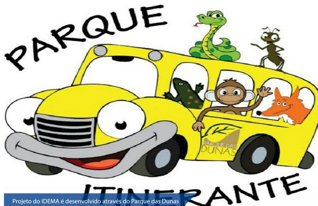
Projeto do IDEMA é desenvolvido através do Parque das Dunas

Os educadores que desejarem receber o projeto Parque Itinerante podem entrar em contato com o Parque das Dunas, através do e-mail parquedasdunas@rn.gov.br ou pelo telefone 3201-3985/-4440.